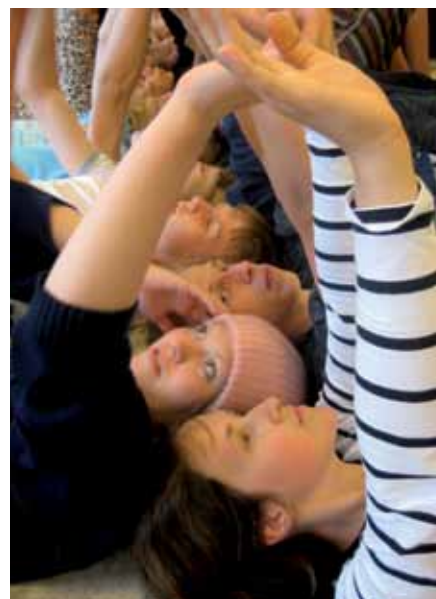
Under veckan pratar ungdomarna om bland annat etik och moral, kärlek och sex, rasism, mänskliga rättigheter och genus.

Fotnot: Anmälan till nästa års läger öppnar i slutet av oktober.