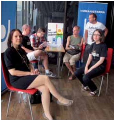
Humanisternas hbtq-nätverk tog emot intresserade besökare på Pride Sergel.