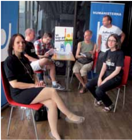
Humanisternas hbtq-nätverk tog emot intresserade besökare på Pride Sergel.