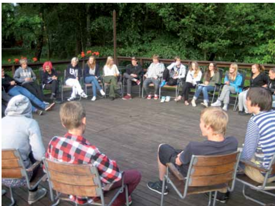
Ett sätt att lära ungdomarna att ta eget ansvar var att se om de klarade av att komma till morgonsamlingen klockan 09.00. De som klarade av det fick en överraskning som belöning.

terna Skåne, höll ett högtidstal och citerade Sokrates: